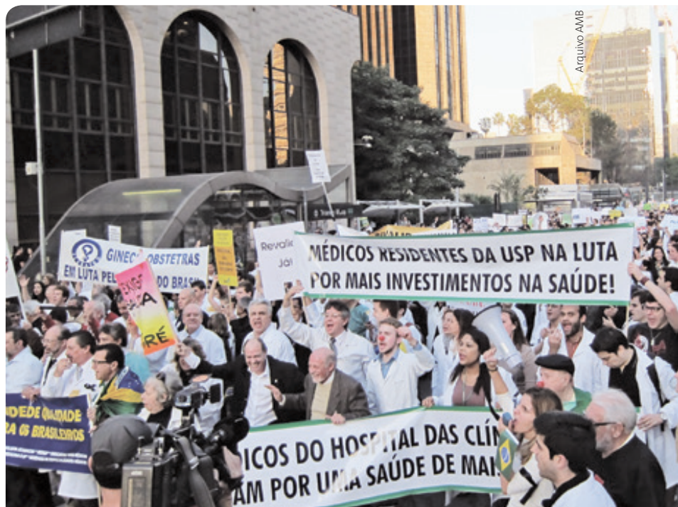
► Desde a criação, em 2013, o Mais Médicos enfrentou críticas por conta de suas motivações e método de execução