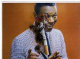
Flor King Cole (1942) "Don't You Worry About a Thing"