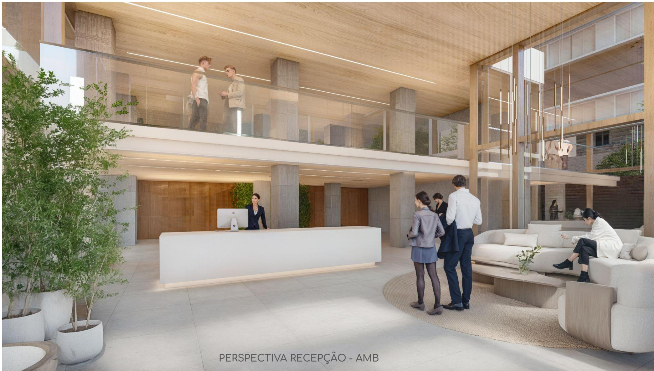
PERSPECTIVA RECEPÇÃO - AMB