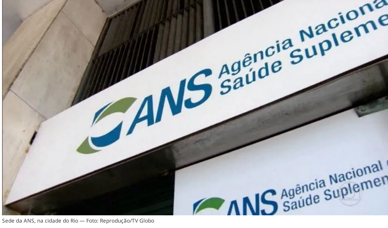
Sede da ANS, na cidade do Rio